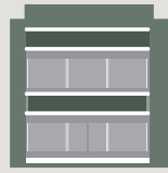
Ιδιωτική Εκπαίδευση - Κοινωνική Μέριμνα